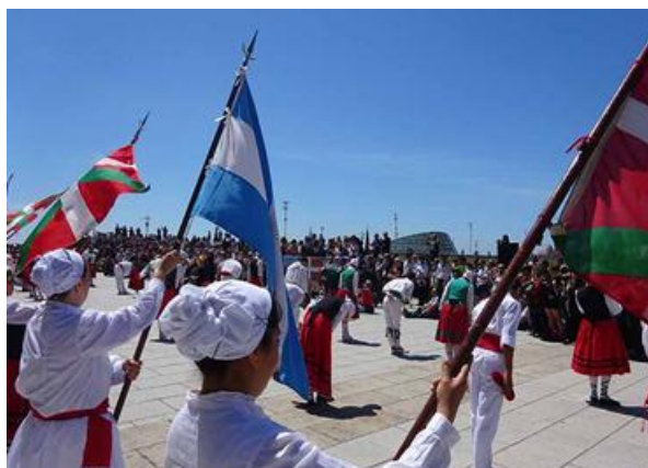
Actos durante la semana vasca