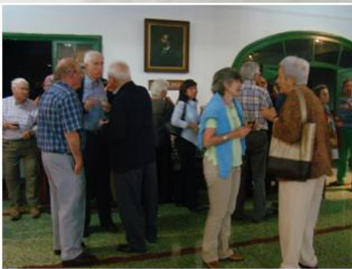
Brindis posterior a la Conferencia.