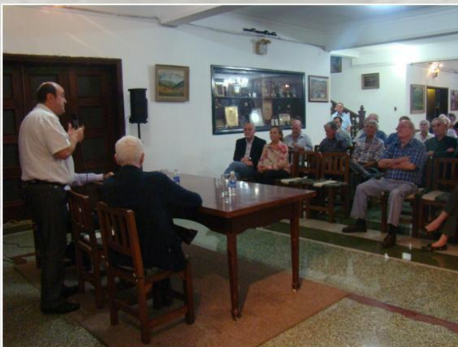
Ortuzar dirigiéndose al auditorio.

comunidades vascas más o menos fuertes, más o menos numerosas, en prácticamente toda Latinoamérica, Estados Unidos, gran parte de Europa, en Asia, para ser un pueblo tan pequeño que somos tenemos mucha gente fuera, aprovechemos esa octava provincia, antes éramos zaspia bat, ahora vamos a tener que poner Zortziak bat, y ahí es donde vosotros vais a tener que jugar un papel, claro teniendo en cuenta que cada comunidad está unida al sitio donde vive, al país en el que esta, y nosotros tendremos que poner a funcionar aquellos mecanismos de ayuda que el gobierno de Patxi López elimino, habrá que tratar de reflotar un poco la Diáspora vasca por todo el mundo”, finalizo indicando “que ustedes no son solo espectadores de lo que está sucediendo en Euzkadi, podéis ser protagonistas de todo esto, lucha con la crisis económica, tema de la paz, el nuevo estatus político, donde tenéis una voz calificada que tenéis que hacer oír, y el PNV os abre la puerta a que esa participación sea posible.”