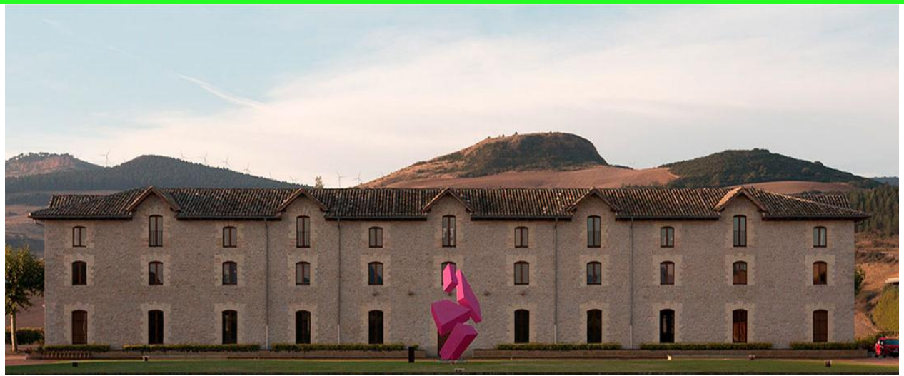
Bodegas Otazu, Nabarra, Euzkadi